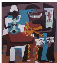
Pablo PICASSO I tre musicisti , 1921