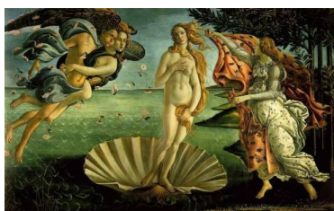
Sandro BOTTICELLI Nascita di Venere , circa 1482-85

Gabriele D'ANNUNZIO, Il piacere , 1889 (ed. utilizzata 1928)